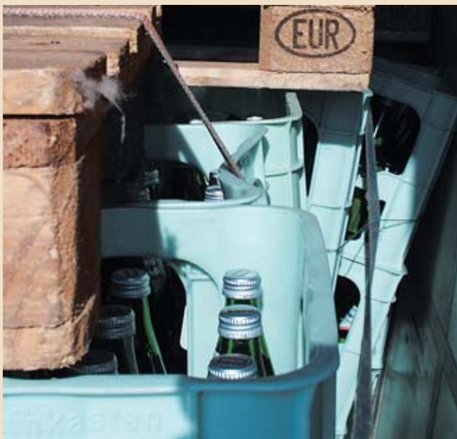
Die Paletten waren nicht deckungsgleich aufgelegt und unter den Zurrgurten befanden sich keine Kantengleiter.