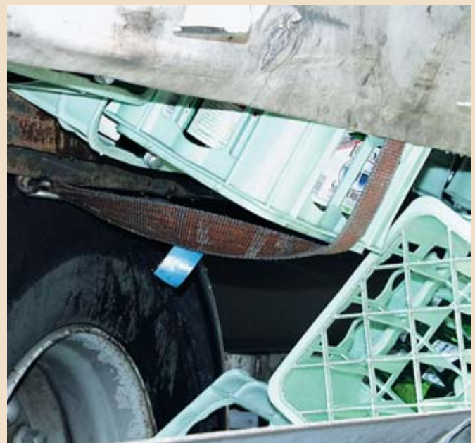
Sogar direkt dort, wo die Zurrgurte verspannt waren, konnte die Ladung nicht gehalten werden.