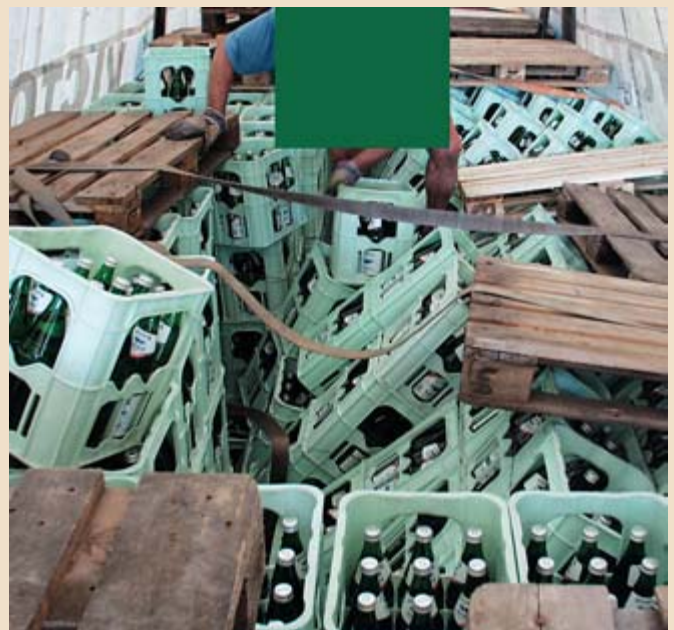
Hier kann nichts mehr aufgestellt werden, die Ladung muss fast komplett abgeladen werden.